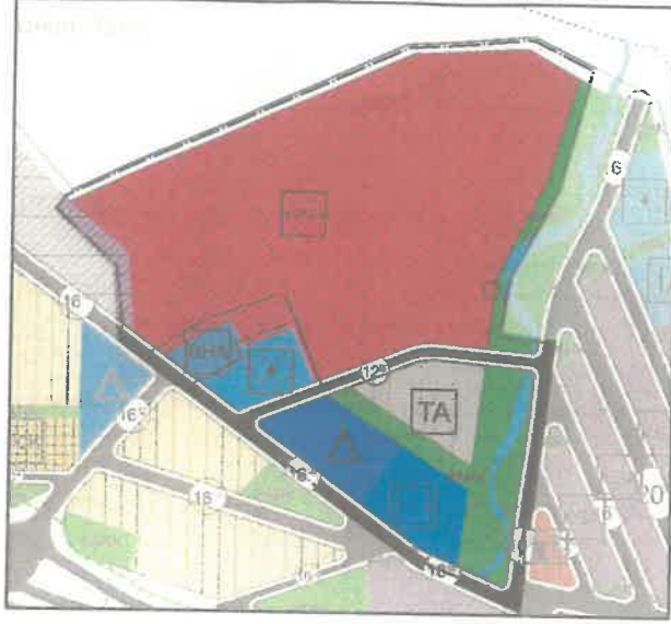
Planlama Alanının 1/5000 Dursunbey İlçesi İlave + Revizyon Nazım İmar Planı'ndaki Konumu

Planlama alanı Dursunbey İlçesi, Çiftçi Mahallesi, 239 Ada – 49 Parsel ve çevresi, 1/5000 Dursunbey İlçesi İlave + Revizyon Nazım İmar Planı'nda "Konut Dışı Kentsel Çalışma Alanı (KDKÇA), Belediye Hizmet Alanı (BHA), Sosyal Tesis Alanı, Eğitim Alanı, Sağlık Alanı, Park ve Yeşil Alan, Teknik Altyapı Alanı ve İkinci Derece Yol alanında" kalmaktadır.