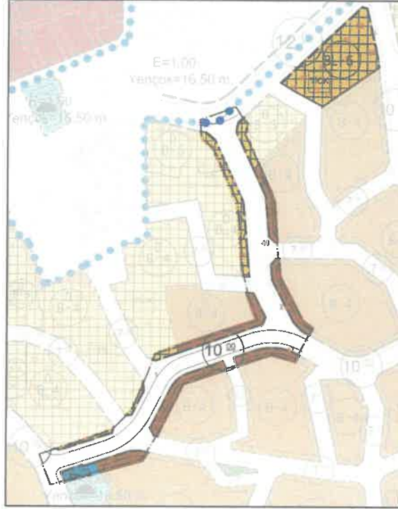
Planlama Alanının 1/1000 Ölçekli Meri Uygulama İmar Planı

Planlama alanı, 1/1000 Dursunbey İlçesi İlave + Revizyon Uygulama İmar Planı'nda I21-D-18-B-4-A Paftasında; Ticaret+Konut, Konut, Taşıt Yolu ve Yaya Yolu ve Bölgesi lejantında kalmaktadır.